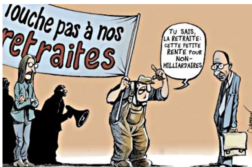
Quand les manifestants croisent le cumulard Jean-Paul Delevoye